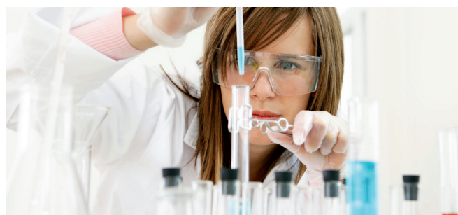
Now and then – Research and development make up a vital part of our company's core competence.